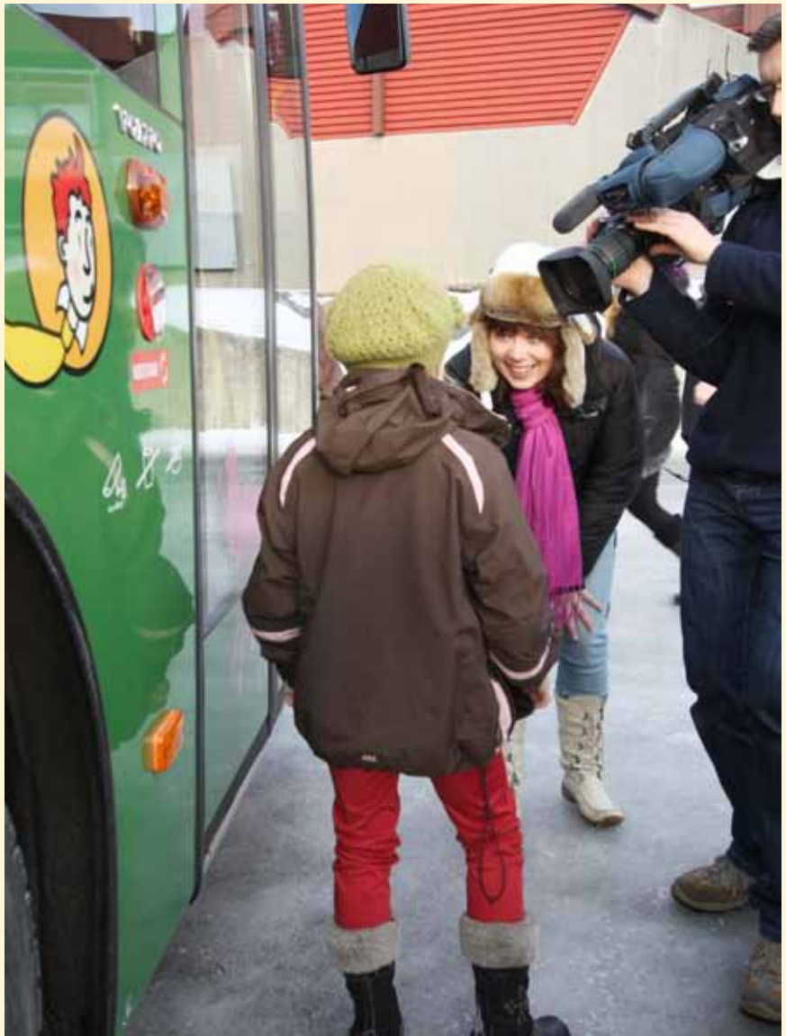
TV-Vest var selvsagt med da elevene ble overrasket med eventyrbussen.