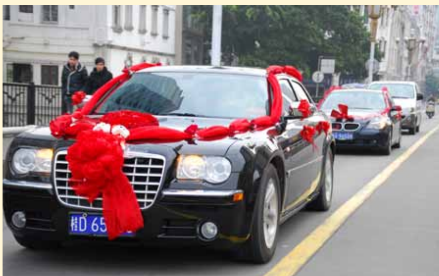
Parade gjennom byen: - Det var med stor oppsikt at den norske brudgommen med sitt reisefølge på om lag 10 europeere inntok Wuzhou i Sør-Kina, brudens fødeby. Det ble en storslagen og vellykket bryllupsfeiring etter kinesiske tradisjoner, som begynte tidlig klokken 8 om morgenen – som er et lykketall i Kina - og varte utover de sene nattetimer!