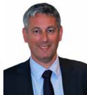
Konsernsjef Kjetil Førsvoll