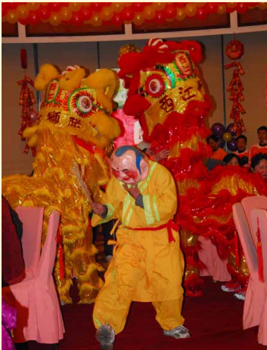
Løver og gjøglere: "Gong xi fa chai!" sa de 500 gjestene da de ankom selskapslokalet. Det er nettopp blitt Tigerens år på den kinesiske kalenderen, og dette sies med ønske om et godt nytt år, rikdom og lykke.