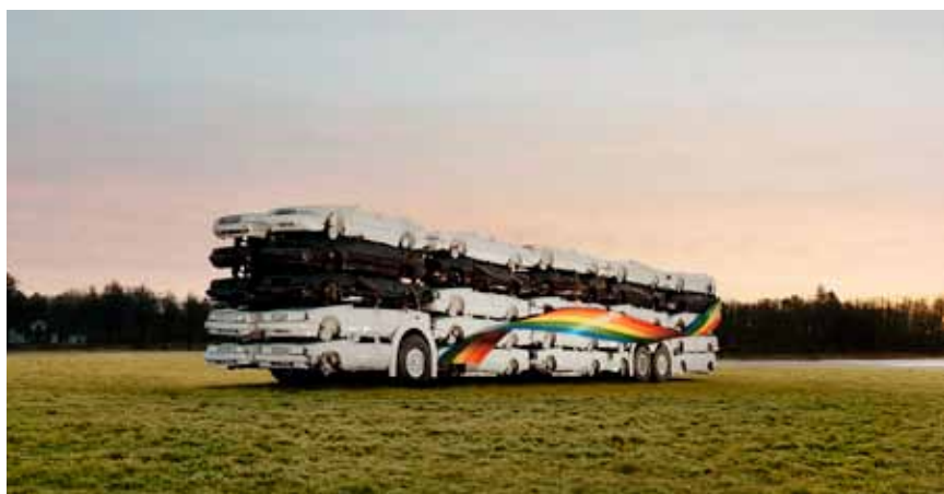
Hele 50 bilvrak ble til én buss på et jorde ved motorveien til Arlanda lufthavn utenfor Stockholm.

For å illustrere dette ble det bygget en 24 meter lang buss av 50 vrakede biler (mest Volvo og Saab). Bussen ble plassert ved siden av motorveien på vei til Arlanda, den største flyplassen i Sverige. Samtidig ble det lansert en egen internettside med et live-kamera som fulgte byggingen av installasjonen. I tillegg var det et telleapparat som registrerte forholdet mellom biler og busser på motorveien, og et regnskap som viste besparelsen av CO2.