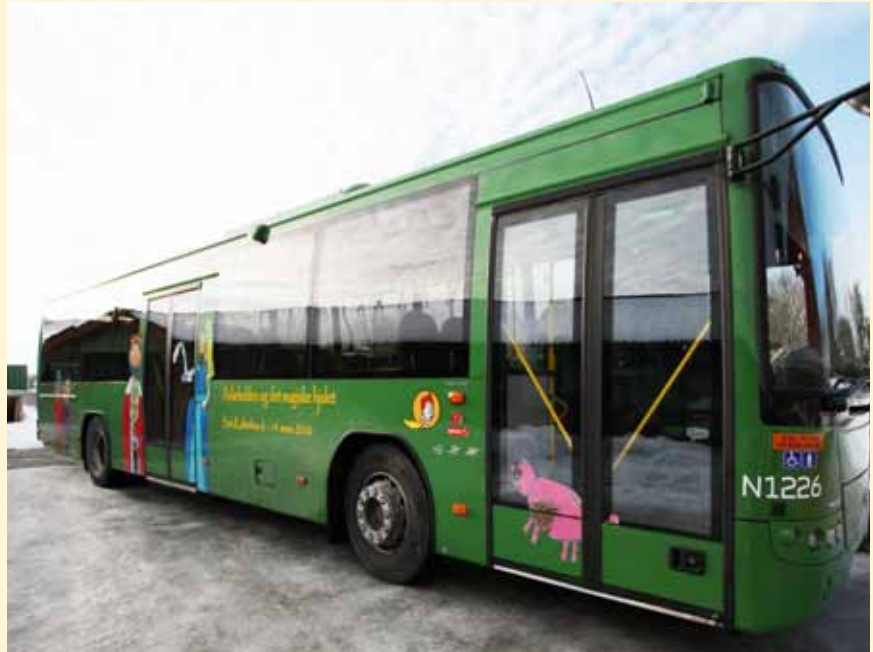
Med flotte tegninger fra fjerdeklasse på Dysjaland Skule har Nord-Jæren fått sin egen eventyrbuss.

Hvilke ruter bussen kommer til å kjøre framover, er ikke bestemt. Men den vil gå flere forskjellige ruter slik at flest mulig får se den.