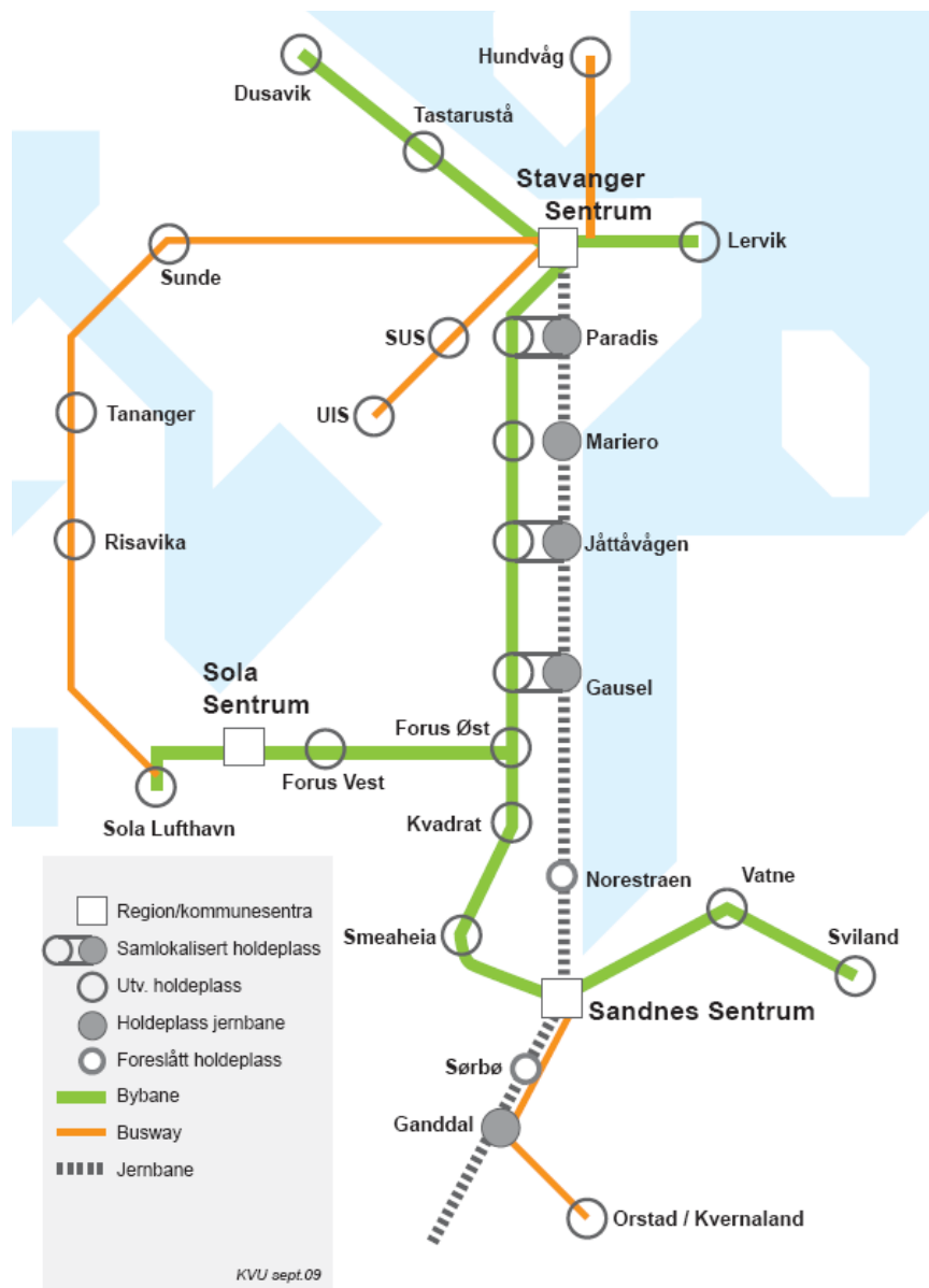
Illustrasjon over bybanekonseptets infrastruktur og drift.