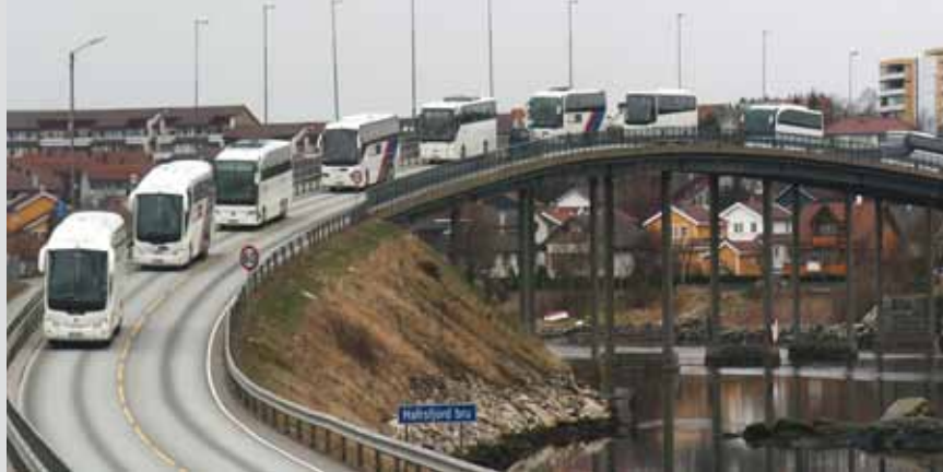
Et daglig syn er Veolias turbusser på vei over Hafrsfjordbruen til ConocoPhilips.

På bakgrunn av ovennevnte planer, vil over 60 % av kollektivtransport med buss vil være konkurranseutsatt i løpet av de neste to årene, og det estimeres at andelen er over 80 % innen 2015.