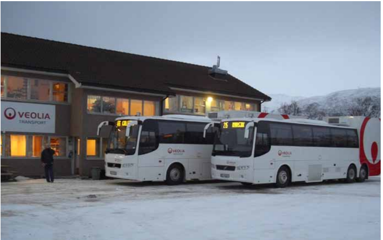
Kombivognene klar for første ruteavgang fra Lakselv rutebilstasjon til henholdsvis Kjøllefjord og Karasjok.